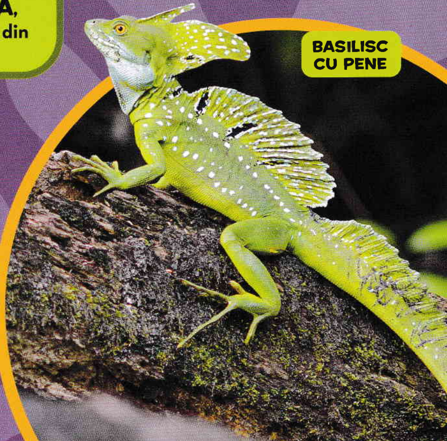
BASILISC CU PENE